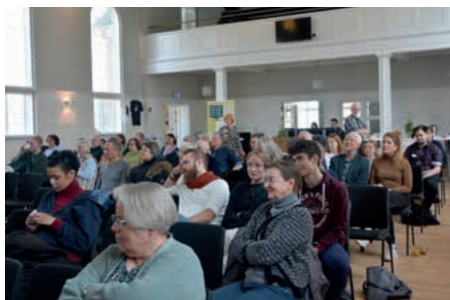
Mellem 80 og 90 i alle aldre fyldte godt op i Aarhus Bykirke.