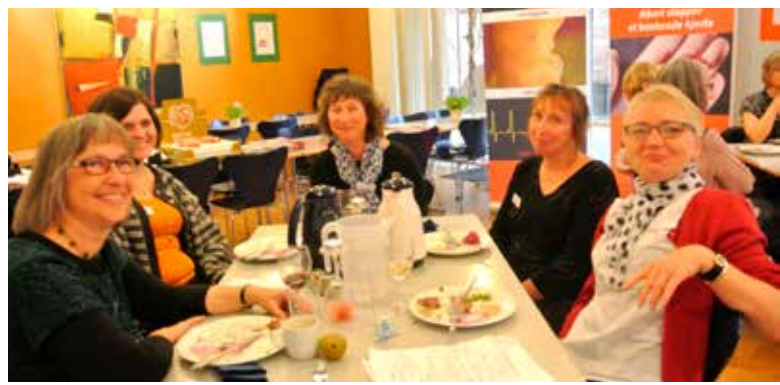
Artiklens forfatter sidder som nummer to fra højre.

Derefter var der anledning til at dele sin erfaring med de andre. Enten man havde haft en svær samtale og havde brug for