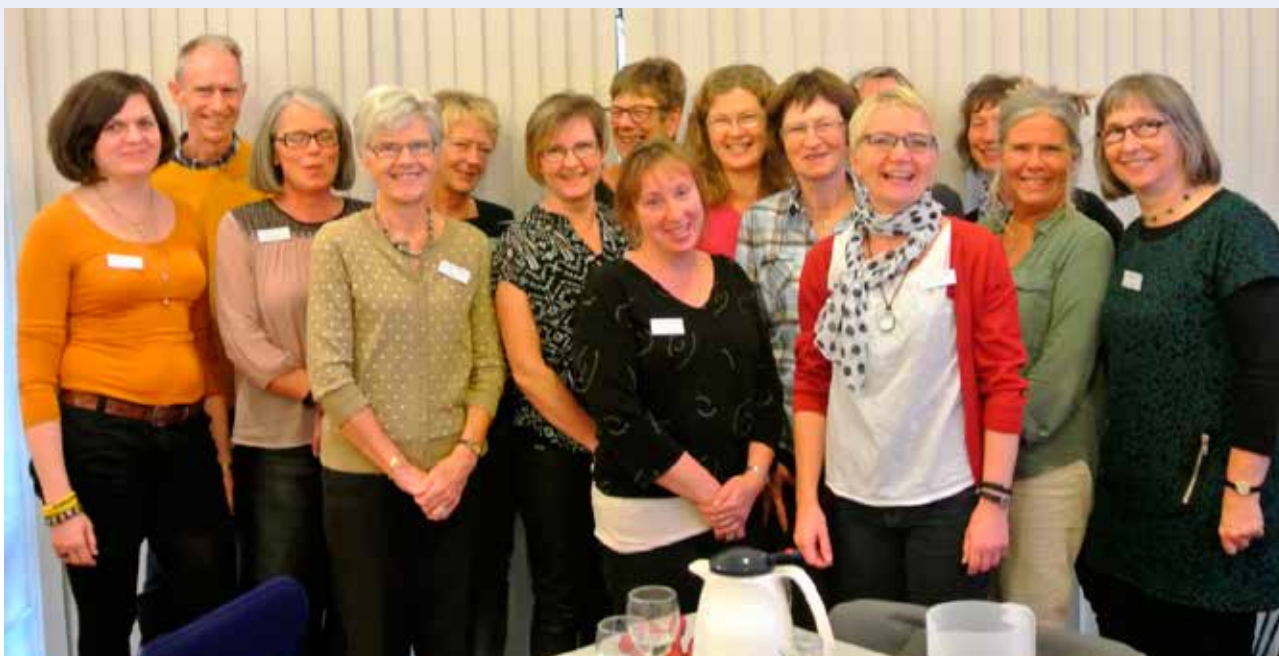
Et udsnit af de abortlinierådgivere samt "ringere", som deltog i inspirationsdagenn i Odense.