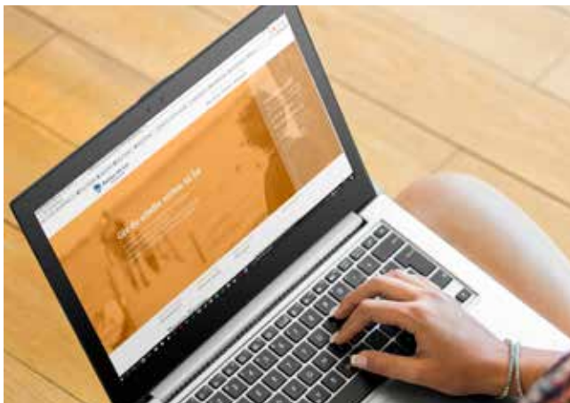
Retten til Livs hjemmeside: www.rettentilliv.dk

Retten til Liv har taget hul på det nye år med to nye hjemmesider!