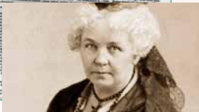
Elizabeth Cady Stanton 1815 - 1902

i et magtsamfund, hvor det maskuline overalt overmander det feminine og tramper på såvel kvinder som børn. Lad kvinden hævde sig selv i al sin naturlige ægthed, værdighed og styrke og gøre en ende på hele denne lidelse og mordene på hjælpeløse børn". For de tidlige feminister handlede kampen om, at kvinder skulle være lige med mænd, men de skulle ikke være det ved at blive mænd. Moderskabet var en fundamental del af det at være kvinde, og det skulle ikke tages fra kvinden. Ingen kvinde skulle tvinges af sin mand til hverken sex eller abort.