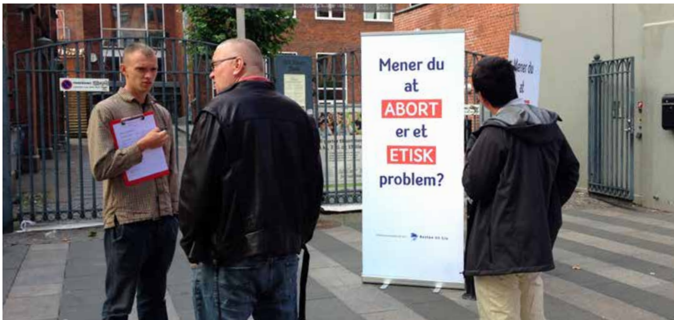
Unge fra Retten til Liv i dialog på gågaden i Aarhus i forbindelse med "Hviskebarns"kampagnen i 2017.

Mennesker reagerer positivt på ærlig og respektfuld tale. Og jeg tror, at det er løsningen på vores "udfordrende kommunikative situation".