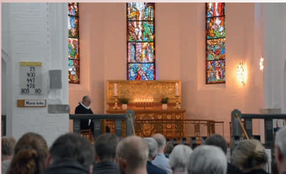
Årsmødet blev afrundet med en fredfyldt forbønsgudstjeneste for de ufødte i Vor Frelser kirke.