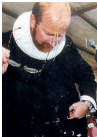
Årets Pressefoto 1995.

Omtalen kastede også noget positivt af sig. Jeg blev inviteret ud at tale mange steder, f.eks. til en paneldebat på Aarhus Universitet på jurastudiet om fosterets