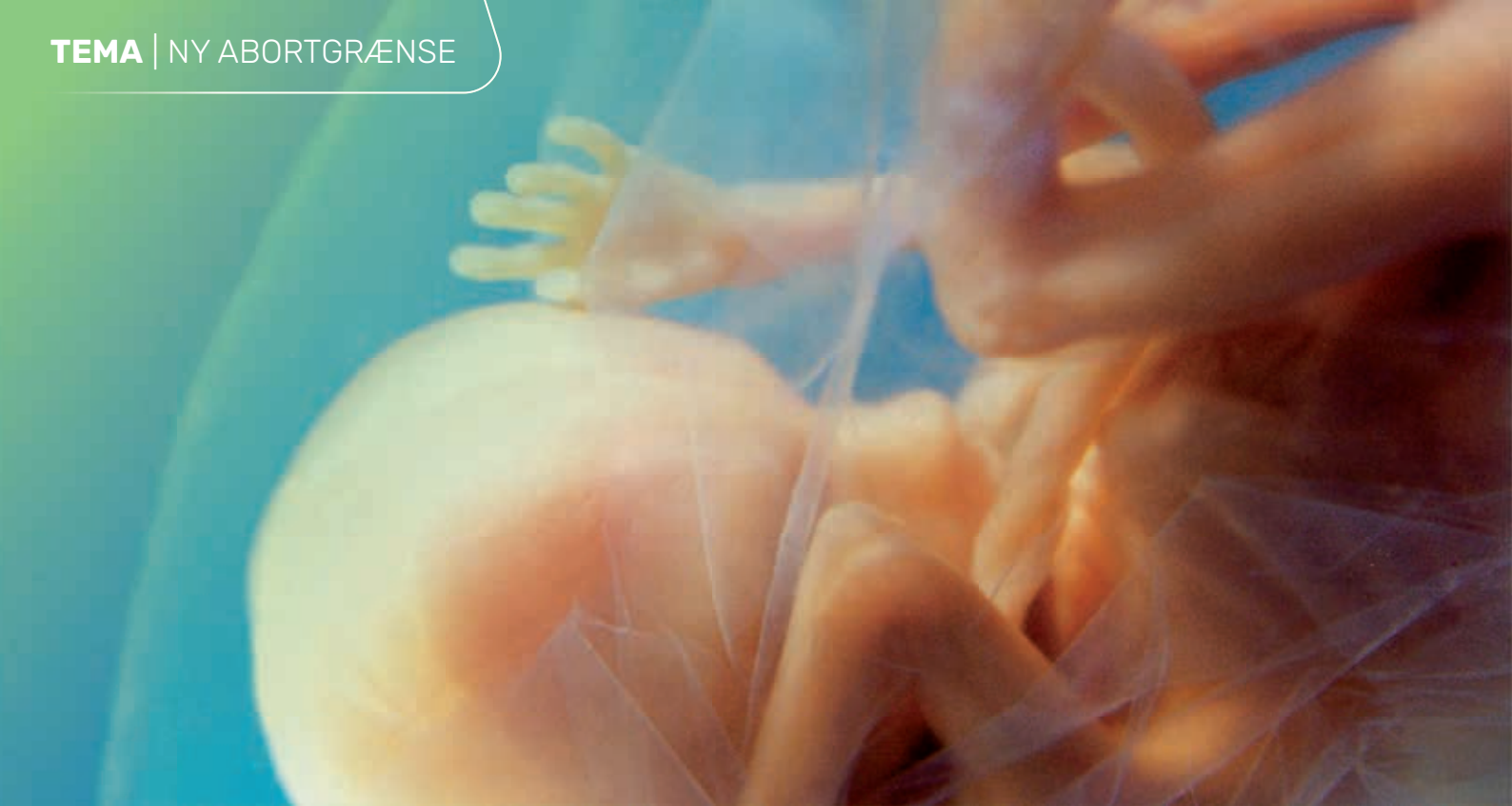
Foster i 17. graviditetsuge.

til kvindens ret til selvbestemmelse. Mens hensynet til sidstnævnte vejer tungest i 12. uge, så har fostret udviklet sig så meget i 18. uge, at vi ikke mener, abortgrænsen bør flyttes dertil. På det tidspunkt kan fostret hikke og strække sig inde i moderens mave. Og det ligner i det hele taget et lillebitte menneske.” 6